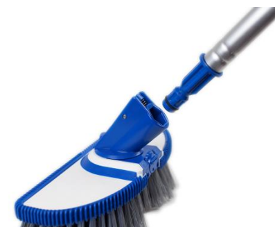
1 Klik - sistem