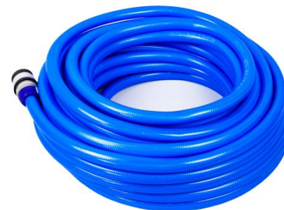
20 metrska cev z 2 hitrima spojkama za priklon