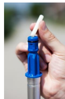
Šampon enostavno vstavite na vrh aluminijastega ročaja